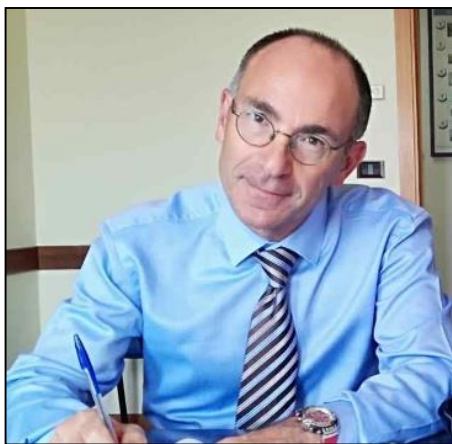
Maurizio Letterio Lanza Commissario Straordinario Asp Catania

L'UOC di Neuropsichiatria dell'Infanzia e dell'adolescenza, diretta da Renato Scifo , è stata individuata dall'Assessorato regionale della Salute, quale Centro di riferimento regionale per l'implementazione del progetto.